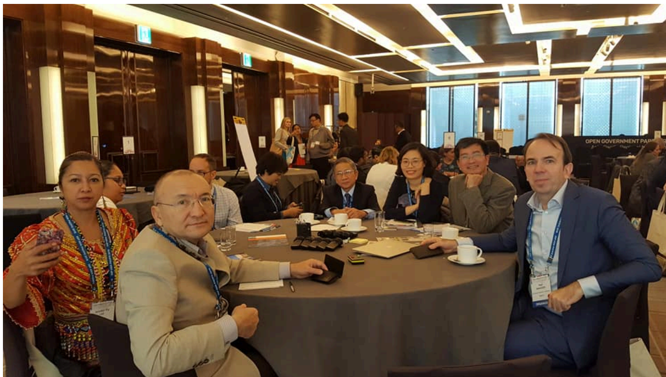
Các thành viên Đoàn công tác trong một phiên họp của Ngày xã hội công dân